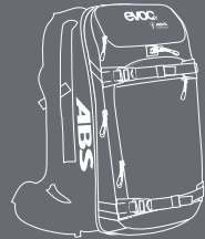
ULTIMATIVES LAWINEN- SICHERHEITS- RUCKSACKSYSTEM