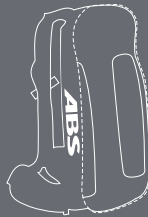
ABS@ VARIO-LINE BASE UNIT