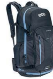
BLACK - MUD 100201102

vergrößert und so die Luftzirkulation erhöht werden. Bei der Abfahrt wird die Distanz zum Rücken wieder verringert und so ein stabiler, bewegungsneutraler Sitz des Rucksacks garantiert.