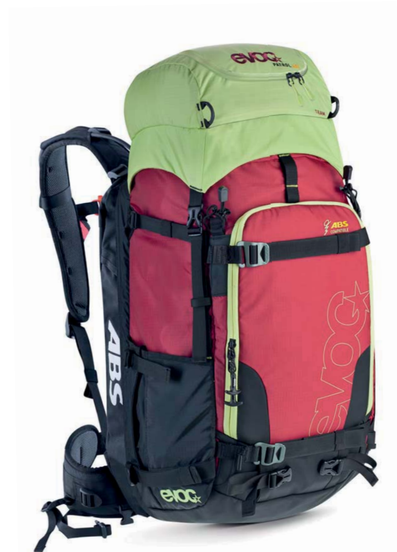
team LIME - RUBY - BLACK 4208 - 139