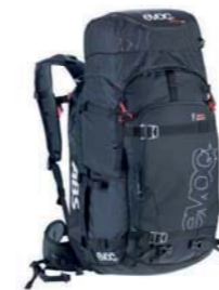
BLACK 4208 - 101