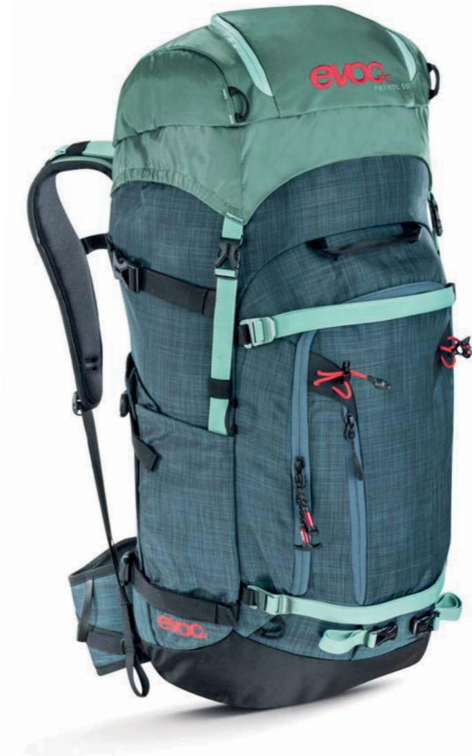
HEATER SLATE - OLIVE 7205 - 172