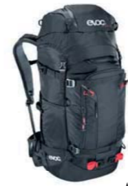
BLACK 7205 - 101

Darüber hinaus wurde die Polsterung in den seitlichen Rückenbereichen reduziert, um den Luftabfluss weiter zu optimieren.