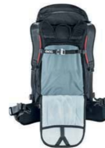
ZUGANG ZUM HAUPTFACH ÜBER RÜCKEN