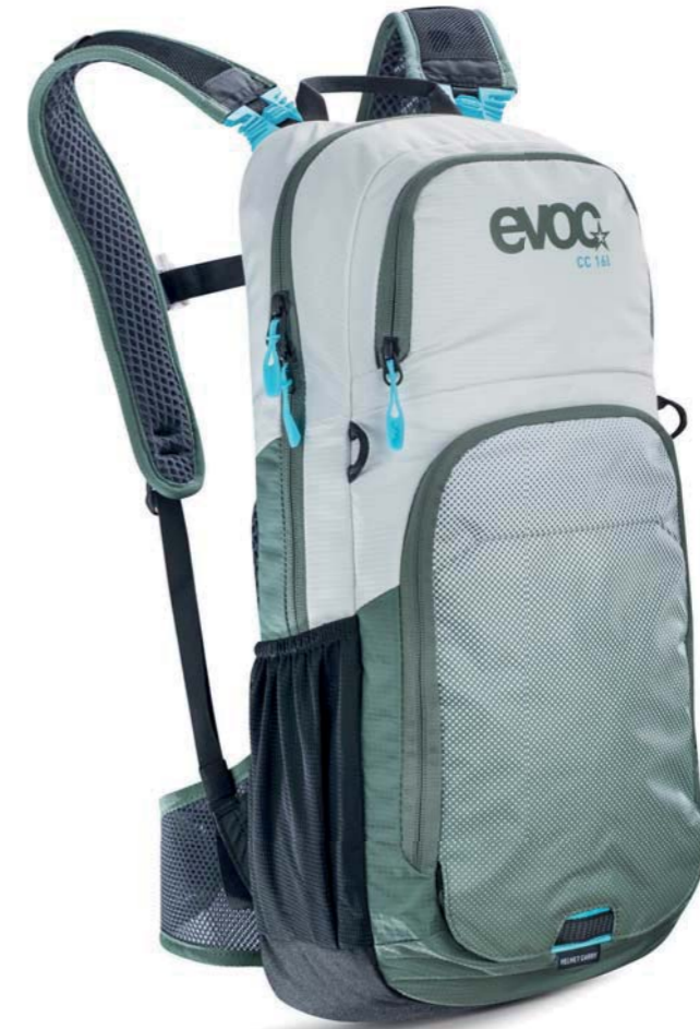
WHITE - OLIVE 100312801 100311801*