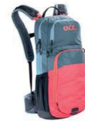
SLATE - RED 100312219 100311219*