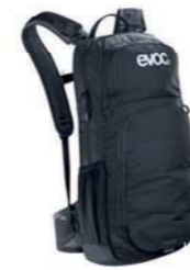
BLACK 100312100 100311100*

Auch das Tragen eines Neck Brace wird durch den BRACE LINK ermöglicht.